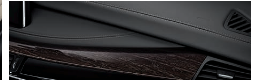
真皮仪表板的独特装饰线条突显了高级内饰设计。

为驾驶者和前座乘客设计的电动可调舒适型座椅配有象牙白 Nappa 扩展真皮内饰 (此处所示带有主动座椅通风系统)。高级美国橡木木饰, 高光为高级内饰的点睛之笔, 为其增添了和谐的氛围。