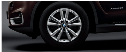
铝合金轮圈，双辐式样 446 型，18 英寸，防爆轮胎，8.5 J x 18 英寸，配 255/55 R 18 轮胎。