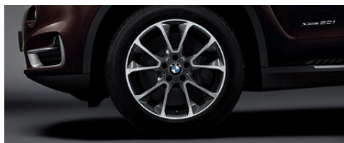
铝合金轮圈，星式轮辐 449 型，19 英寸，防爆轮胎，9 J x 19 英寸，配 255/50 R 19 轮胎。