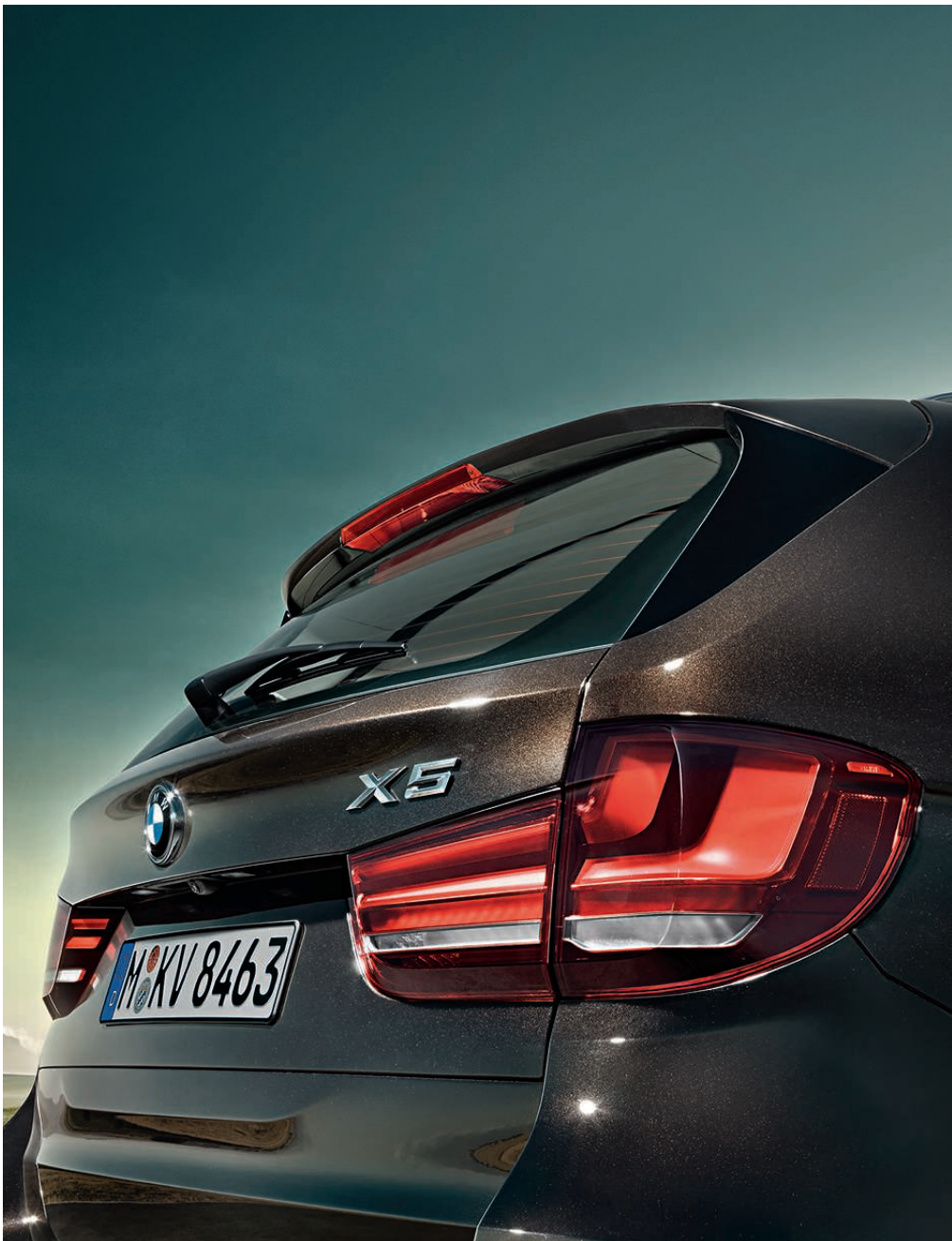
BMW 高效动力策略 (BMW EfficientDynamics)