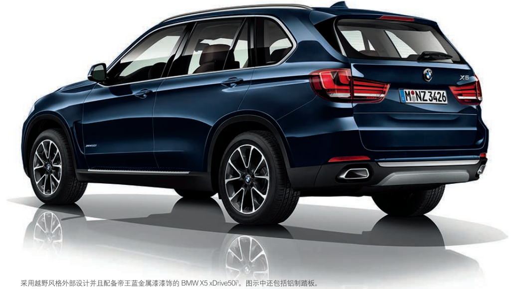
采用越野风格外部设计并且配备帝王蓝金属漆漆饰的 BMW X5 xDrive50i 1 。图中还包括铝制踏板。