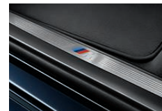
运动型外观: 带“M”标志的铝合金迎宾踏板。