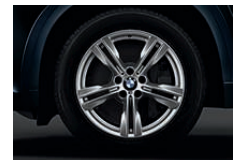
M 铝合金轮圈, 双辐式样 467 M 型, 19 英寸, 前轮 9 J x 19 英寸, 配 255/50 R 19 轮胎, 后轮 10 J x 19, 配 285/45 R 19 轮胎。