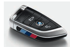
采用“M”设计的车钥匙。