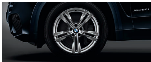
M 铝合金轮圈，双辐式样 467 M 型，19 英寸，混装轮胎，防爆轮胎，前轮 9 J x 19 英寸，配 255/50 R 19 轮胎，后轮 10 J x 19 英寸，配 285/45 R 19 轮胎。