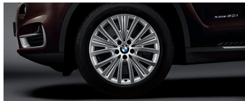
铝合金轮圈，多辐辐 448 型，19 英寸，防爆轮胎，9 J x 19 英寸，配 255/50 R 19 轮胎。