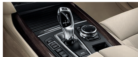
8 速手自一体变速箱借助发动机转速的迅速转换和更短的换挡时间使换挡和驾驶明显变得更加便捷。它将出色的舒适性 with 明显的动态性和更高的燃油效率结合在一起。