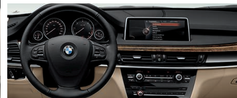
多功能真皮方向盘，用于操作巡航控制系统和收音机或电话。