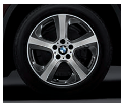
铝合金轮圈，星式轮辐 490 型，19 英寸，防爆轮胎，9 J x 19 英寸，配 255/50 R 19 轮胎。