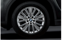
铝合金轮圈, 多辐辐 448 型, 19 英寸, 9 J x 19 英寸, 配 255/50 R 19 轮胎。