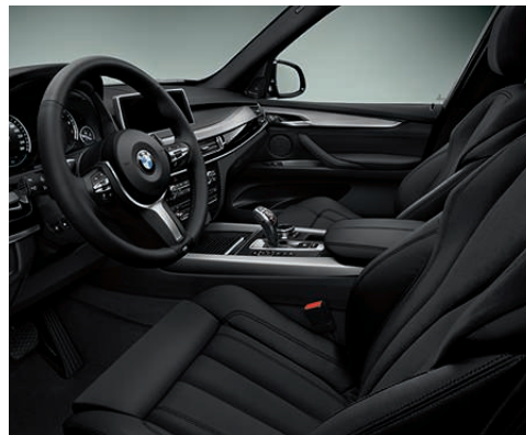
前排运动型座椅 (高级真皮材质内饰, 滚边中带 M 标志) 和 M 运动型多功能真皮方向盘赋予内装非常运动的感觉。

带“M”标志的铝合金迎宾踏板 M 运动型多功能真皮方向盘, 包括多功能按钮、换挡拨片和“M”标志 前排运动型座椅 高级真皮内饰, 包括滚边中的 M 标志 高级美国橡木木饰 M 车型搁脚板 个性版墨灰色车顶篷