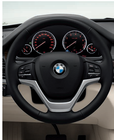
多功能运动型真皮方向盘，黑色，3 辐，带多功能按钮和镀铬镶嵌。 伺服式助力转向系统可根据车速来调节转向功率。 主动转向系统在任何行驶状态下都具有精准、灵活和舒适的特点。 方向盘加热功能。只需按下按钮，方向盘外圈便可在短时间内变热——在冬季会令人感到极为舒适。