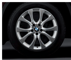
铝合金轮圈，V 式轮辐 450 型，19 英寸，防爆轮胎，9 J x 19 英寸，配 255/50 R 19 轮胎。