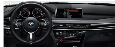
M 运动型多功能真皮方向盘配有多功能按钮、M 标志、更加显著的拇指靠以及更厚实的方向盘外圈 (从而更好地抓握)。