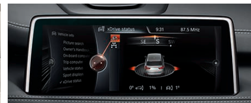
xDrive 状态在仪表板和控制显示屏上提供越野驾驶的相关信息。除了指南针功能 (仅与 BMW 专业级导航系统搭配) 以外，它还以图形的形式并以度为单位显示车辆的倾角。