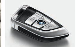
带珠光镀铬细节装饰的车钥匙。