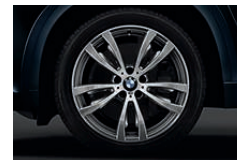
M 铝合金轮圈, 双辐式样 469 M 型, 20 英寸, 前轮 10 J x 20 英寸, 配 275/40 R 20 轮胎, 后轮 11 J x 20, 配 315/35 R 20 轮胎。